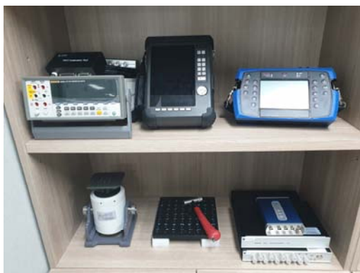
실습 장비 - 진동계측기