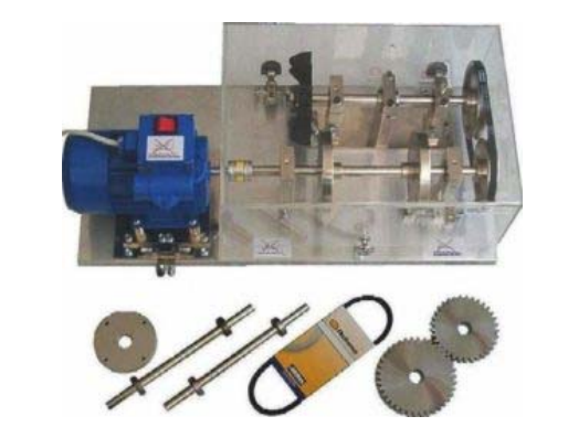
실습 장비 - Rotor Kit Simulator