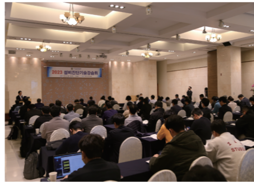
2023 설비진단기술강습회 (1)