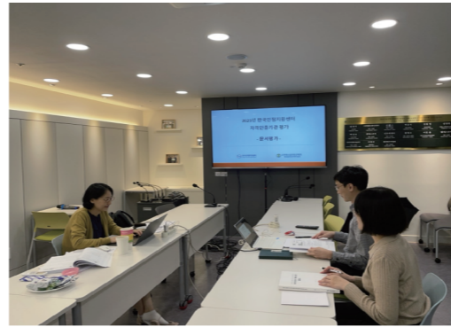
2023 한국인정지원센터 심사 수검