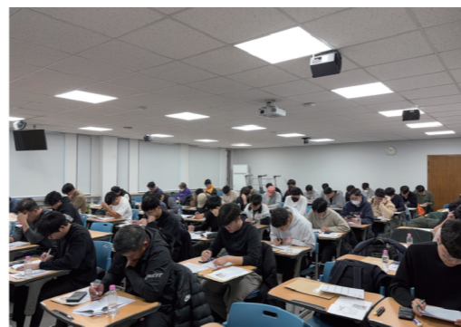
2023년도 제2회 자격인증시험